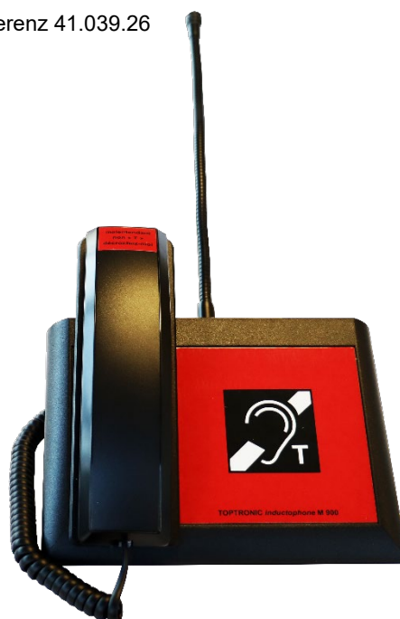
Induktofon M 900 - Referenz 41.039.26

M 900 wird auf die Theke gestellt. Sein flaches Gehäuse gewährleistet offene Sicht.