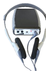
41.014.11 - inductomètre contrôle de boucle