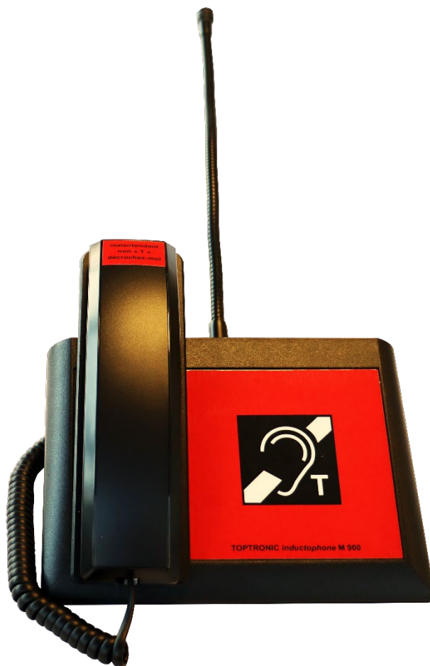
Toptronic M 900 41.039.26

M 900 , la boucle magnétique mobile Toptronic répond à ces exigences :